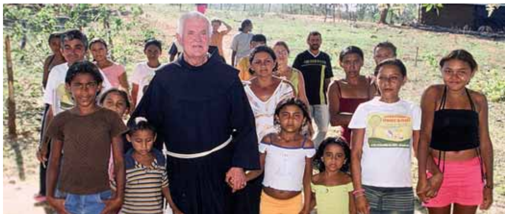
Stimme der Ausgeschlossenen